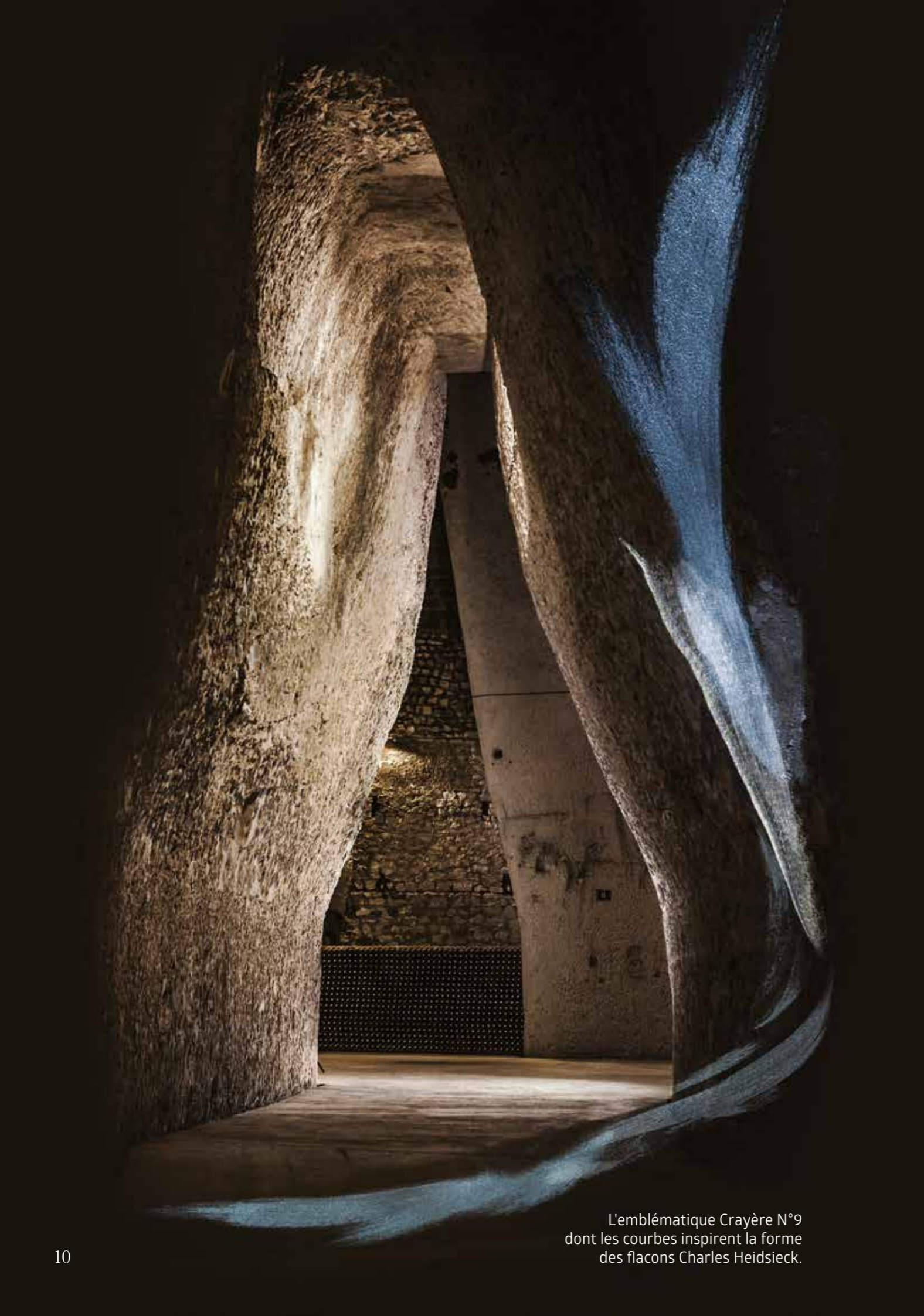
L'emblématique Crayère N°9 dont les courbes inspirent la forme des flacons Charles Heidsieck.